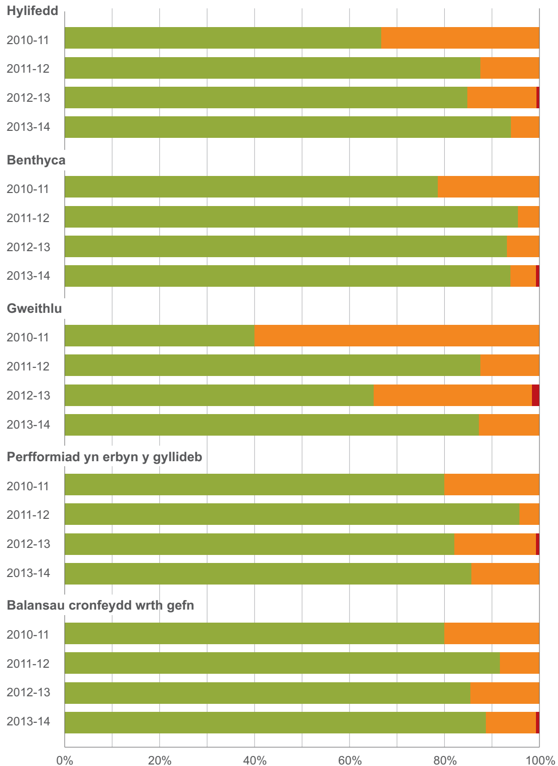
Ffigur 2 – Crynodeb o ddadansoddiad Grant Thornton o berfformiad rheoli ariannol cyngorau yn Lloegr rhwng 2010-11 a 2013-14 Mae Cyngorau yn Lloeger yn parhau i reoli'r risgiau ariannol y maent yn eu hwynebu